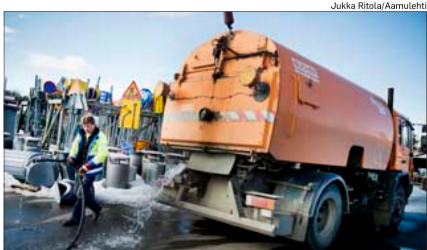
Työ alkoi imuauton vesitankkien huuhtelulla, koska tankeista irtoava ruoste voi tukkia suuttimet. Tankit piti vielä täyttää puhtaalla vedellä.

Tampereen kaupunki aloittaa hiekoitussepin keruun kaduilla ensi viikolla, jos sää vain sallii. → Uutiset A5