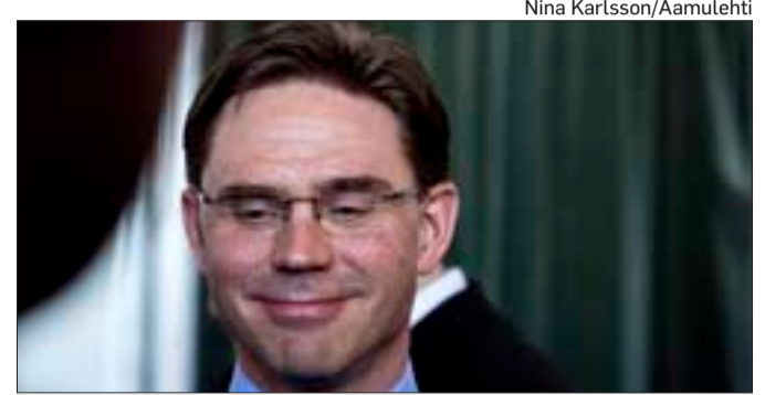
Pääministeri Jyrki Katainen jaksoi myhäillä hallituksen uudelle osinkoveroehdotukselle. Sotku on hänen mukaansa nyt selvitetty. Myös kuntaudistus eteni eilen. Siinä tosin riittää vielä lisää selvitettävää...

Politiikka: Pääministeri Jyrki Katainen (kok) vakuutti hallituksen toimintakykyä. Osinkoveroista äläkän nostanut ministeri Paavo Arhinmäki on myös tyytyväinen. → Uutiset A4