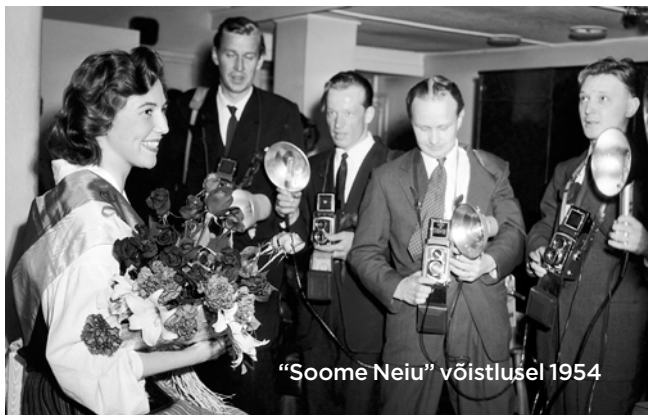
„Soome Neiu“ võistlusel 1954