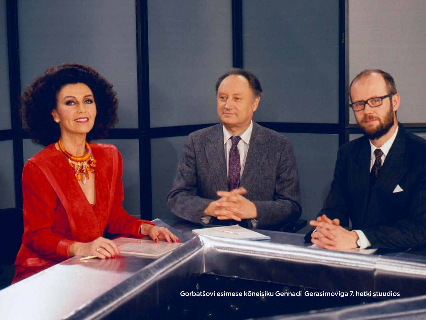
Gorbatšovi esimese kõneisiku Gennadi Gerasimoviga 7. hetki studios